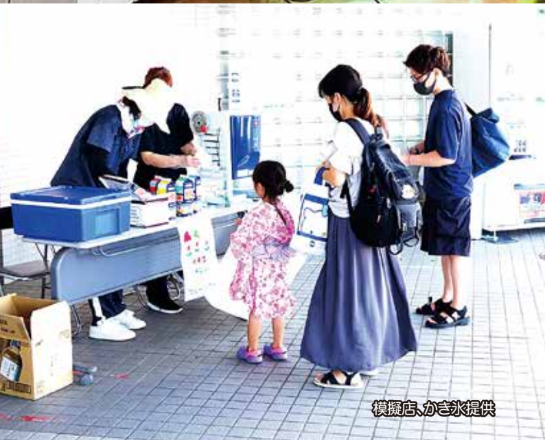
模擬店、かき氷提供