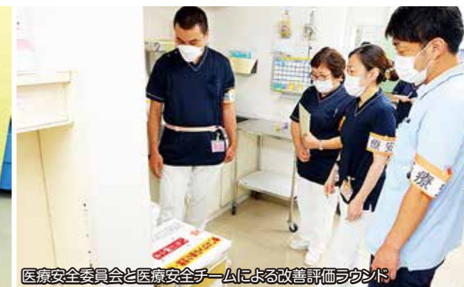
医療安全委員会と医療安全チームによる改善評価ラウンド