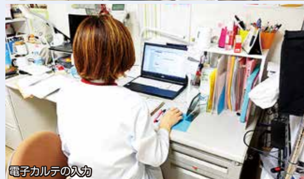
電子カルテの入力