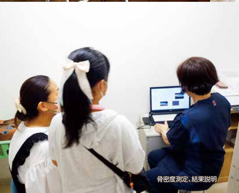
骨密度測定、結果説明