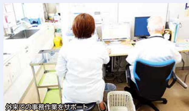
外来での事務作業をサポート

医療クラーク（医師事務作業補助者）は、医師の指示の下、検査の予約、診断書や紹介状など様々な文章の作成、電子カルテの入力など医師の事務業務をサポートする職種です。このサポートにより医師の事務作業の負担が軽減され、患者さんへの診療が円滑に行えるよう業務に取り組んでいます。