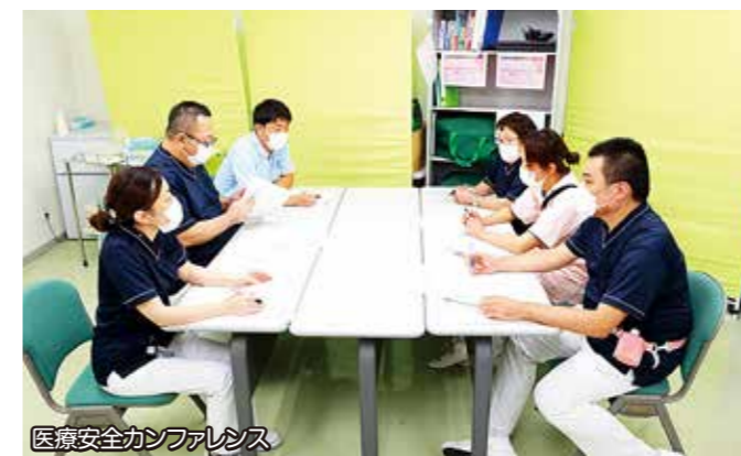
医療安全カンファレンス